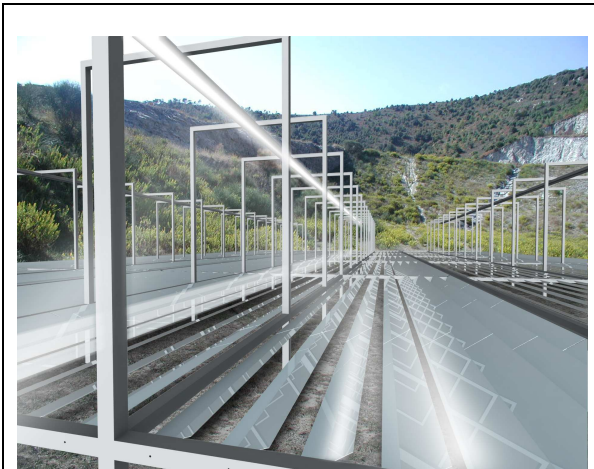
Impianto CSP con specchi linear Fresnel .

Nel 2009, FERA ha avviato la sperimentazione con un prototipo finalizzato allo studio delle componenti e all'efficientamento del sistema. Il prototipo, in costruzione in Sicilia in provincia di Siracusa, fa parte di un ampio progetto per la creazione di una filiera produttiva italiana, FREeSUN , di cui FERA è capofila e che coinvolge importanti aziende italiane e prestigiosi centri di ricerca.